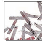
Coupe croisée 2 x 15 mm Niveau de sécurité DIN 4 Documents confidentiels ou secrets.