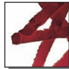
Coupe croisée 4 x 40 mm Niveau de sécurité DIN 3 Documents confidentiels.